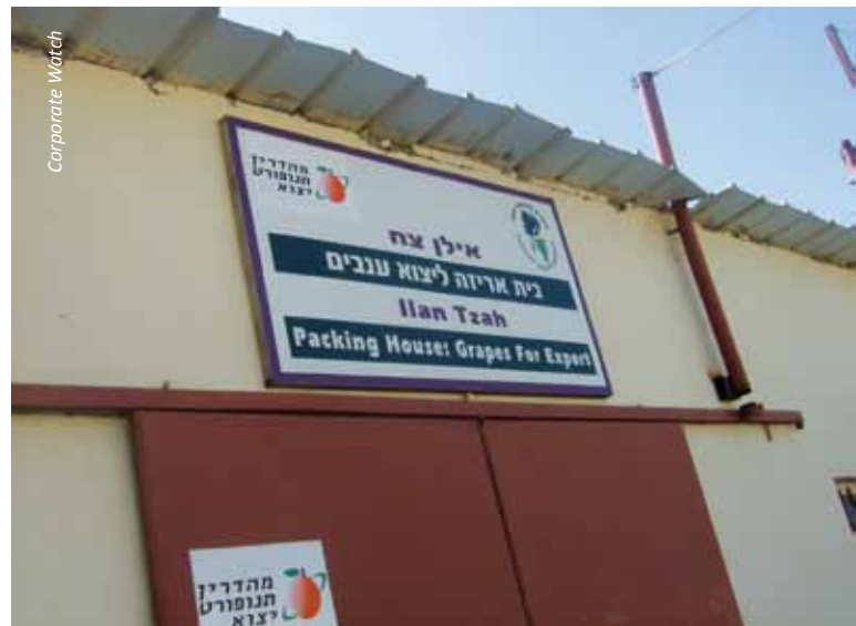
Das Mehadrin-Firmenlogo in Hebräisch an einem Gebäude in der Siedlung Beqa'ot

Mehadrin kooperiert auch mit der staatlichen israelischen Wassergesellschaft Mekorot, um seine Landwirte mit Wasser zu versorgen, und beteiligt sich somit an der Enteignung palästinensischen Wassers. Das Mehadrin-Firmenlogo in Hebräisch an einem Gebäude in der Siedlung Beqa'ot Arbeiter der Mehadrin-Packhäuser sprachen von extrem ausbeuterischen Arbeitsbedingungen.