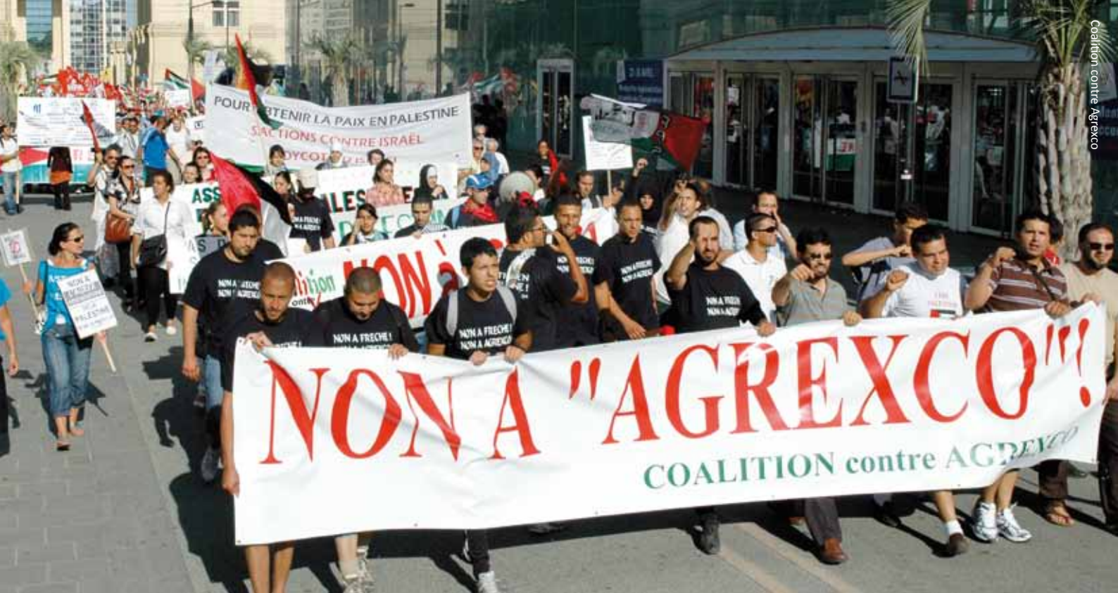
Mehr als 1000 Menschen demonstrierten 2009 in Montpellier gegen die Pläne von Agrexco, ein Umschlagzentrum im nahe gelegenen Hafen von Sète zu bauen. Die Kampagne gegen Agrexco hatte sich auf 13 Länder ausgedehnt und war ein wichtiger Faktor, der zum Konkurs des Unternehmens im Jahr 2011 führte.